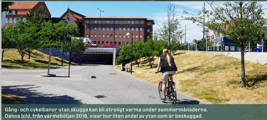
Gång- och cykelbanor utan skugga kan bli otroligt varma under sommarmånaderna. Denna bild, från värmeböljan 2018, visar hur liten andel av ytan som är beskuggad.