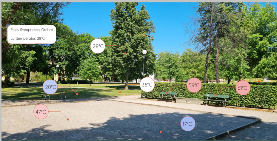
En viktig åtgärd för alla kommuner är att definiera hur stor andel av offentliga ytor och mötesplatser som ska erbjuda naturlig skugga under sommarmånaderna. Bilden talar sitt tydliga språk kring varför detta är viktigt.